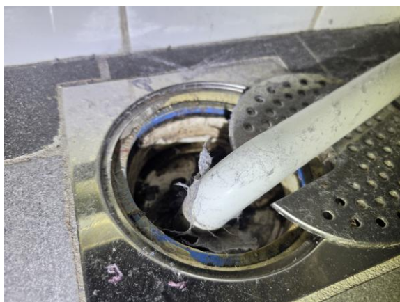
Tvättstuga - Brunnsmanschjetten sticker fram och klämringen och har inte bottnat i sitt säte.