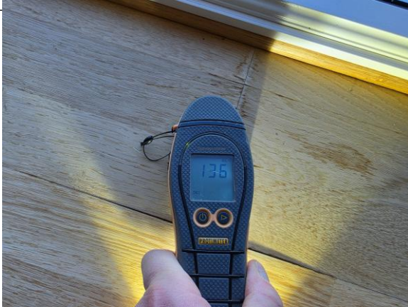
Mindre formförändringar på parkett intill fönsterparti. Vid fuktindikering noterades inga avvikelser.