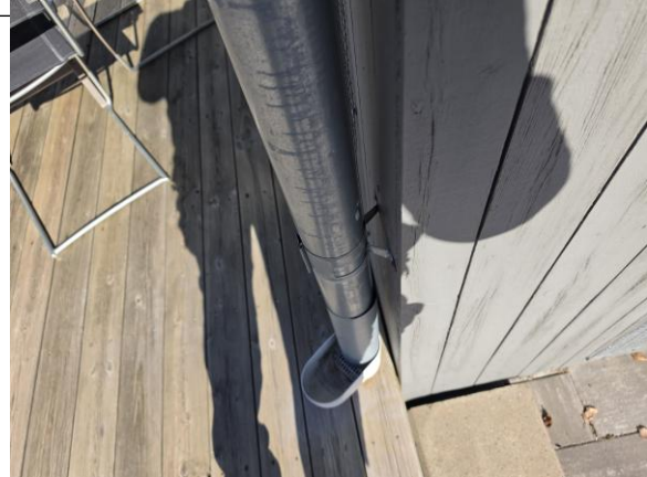
Fals på stuprör är vänd mot fasaden