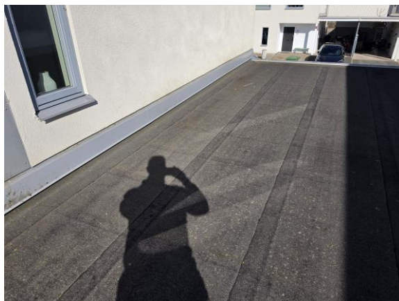
Vy yttertaket på carporten.