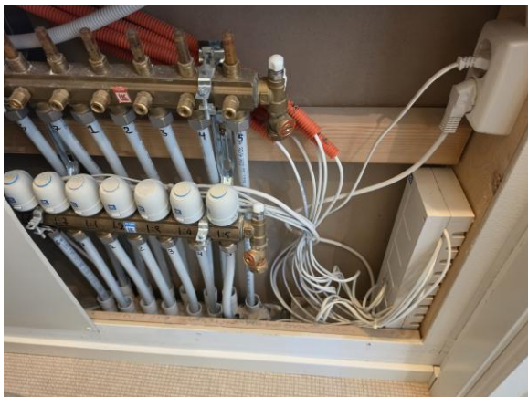
Fördelare till golvvärme placerad i vägg, saknar vattentät botten och läckageindikering.

I denna bilaga visas ett urval av de foton som tagits vid besiktningstillfället.