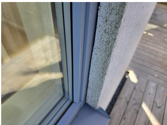
Mindre otätheter mellan fönster och putsfasaden.