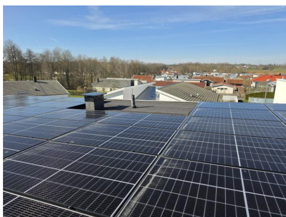
Vy yttertak med solceller.