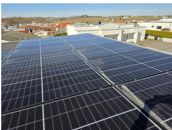
Vy yttertak med solceller.