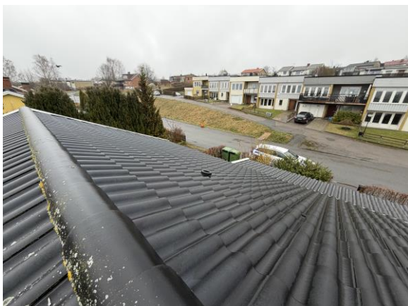
Vy från tak.