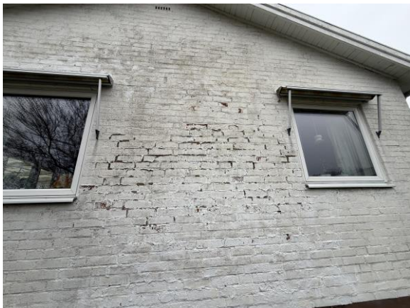
Frostsprängda stenar/fog på södergavel.

I denna bilaga visas ett urval av de foton som tagits vid besiktningstillfället.