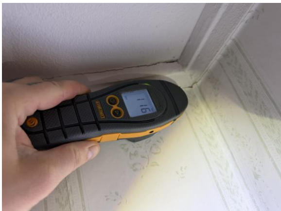
Fuktindikering utförd vid fuktfläck i tak/väggvinkel i hall utan avvikelser.