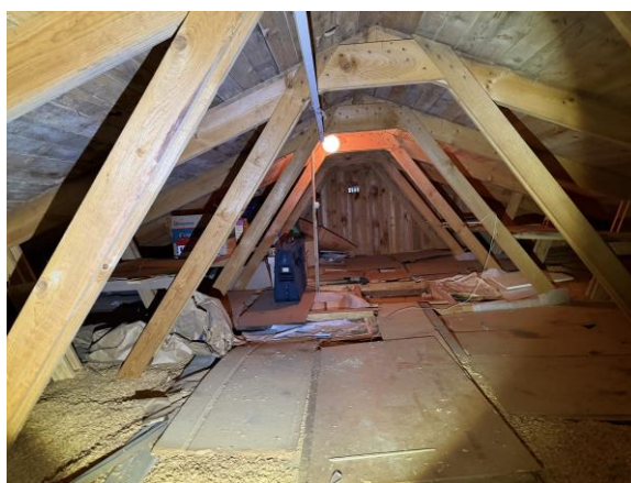
Vy övernockvind med mikrobiell påväxt på underlagstaket.