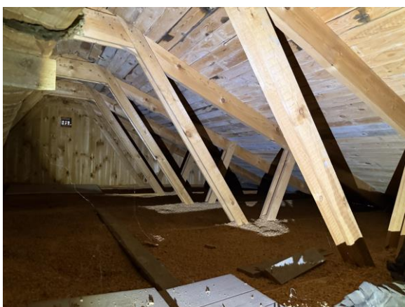
Vy övernockvind med mikrobiell påväxt på underlagstaket.