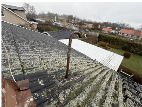
Vy från tak med mossa på takpannor.