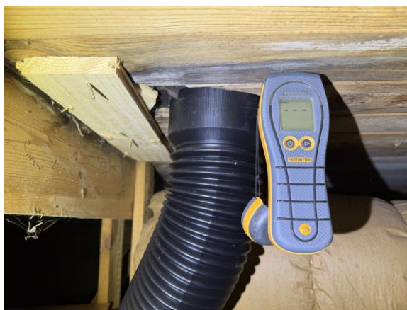
Fuktkvotsmätning utförd i fuktfläck vid avluftare. Torrt vid besiktningsstillfället.