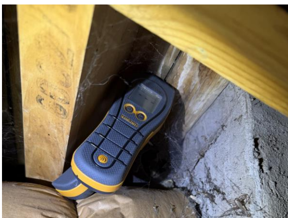
Fuktkvotsmätning utförd i fuktfläck vid murstock. Torrt vid besiktningsstillfället.