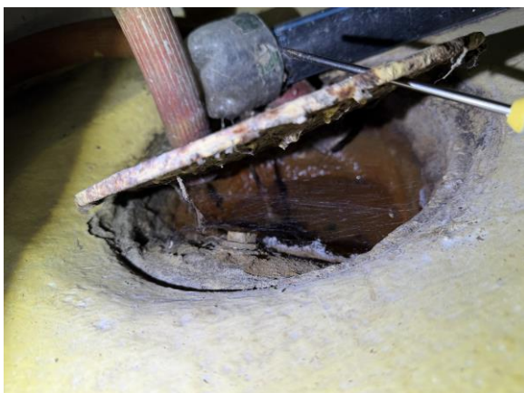
Äldre rostangripna gjutjärnsbrunnar förekommer i källarvåning och wc/dusch på entréplan.