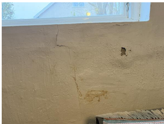
Mindre puts/färgsläpp/sprickor/missfärgningar noterades på väggar i källarvåning. Bild från pannrum.