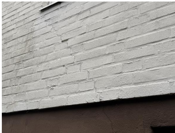
Spricka i tegelfasad/grund.