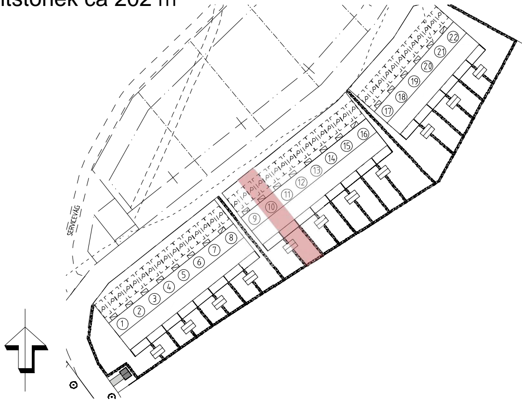
Plan 1 - 56.4 m 2