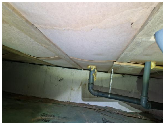
Mikrobiell påväxt på underlagsskivor i krypgrunden