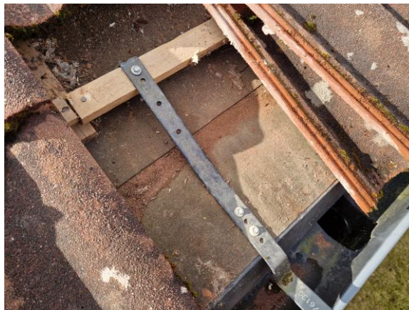
Delar av takpappen är äldre.