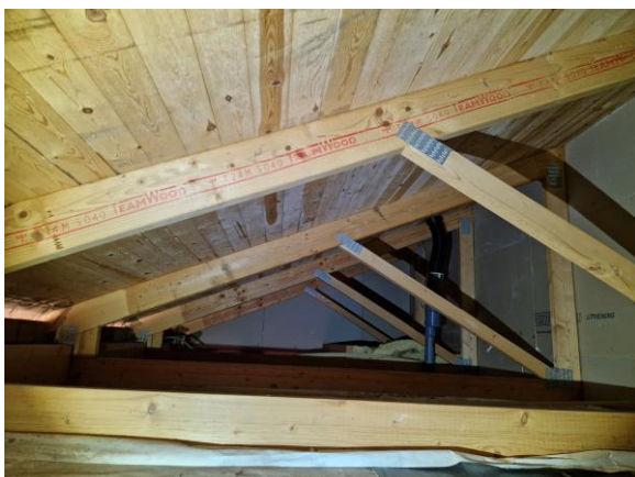
Vindsutrymme. Mindre mikrobiell påväxt på underlagstaket