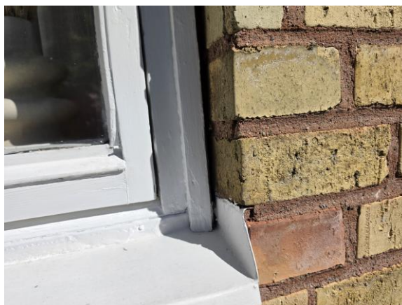
Otäteter förekommer vid fönsterbleck och runt fönster.