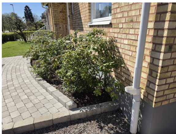
Det förekommer växter intill huset.