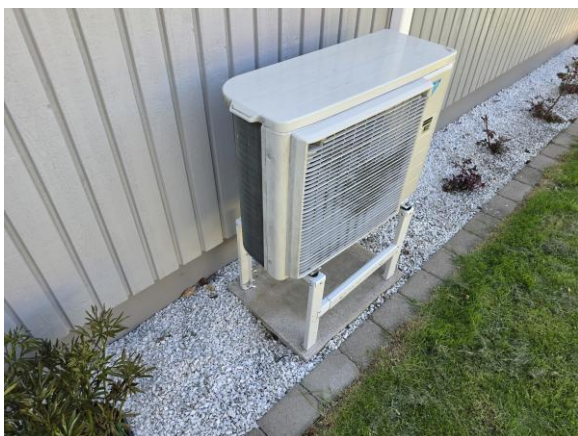
Kondensvatten leds inte bort från luftvärmepumpens utedel.