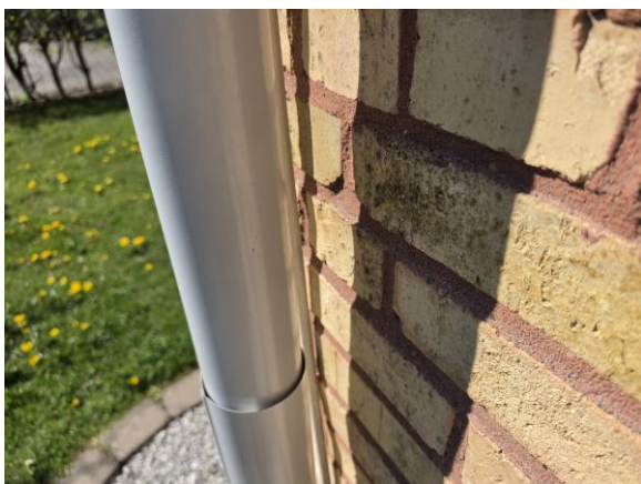
Fals på stuprör är vänd mot fasaden.