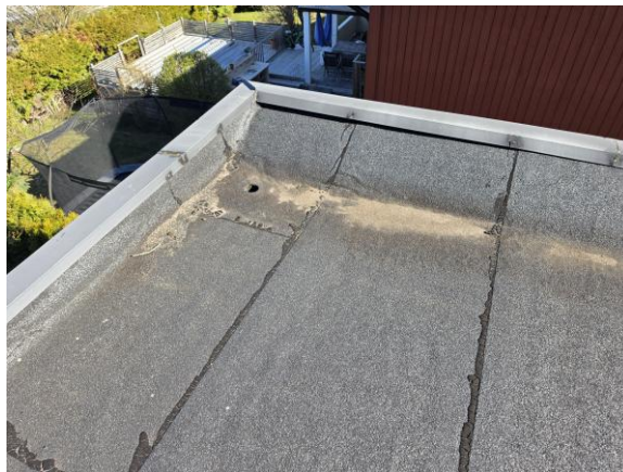
Vy yttertaket på garaget.