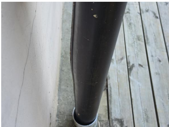
Fals vänd mot fasaden på stuprör, Viss utbuktning förekommer på rören.