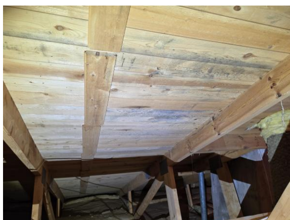
Mindre mikrobiell påväxt noterades på underlagstaket.