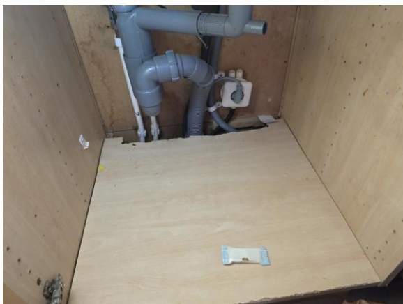
Det finns inget fuktskydd i botten på diskbänkskåpet.