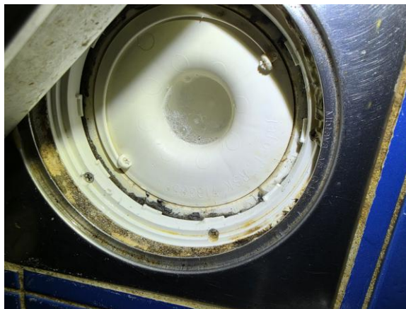
Badrum källare – Brunnsmanschetten sticker fram under klämringen.