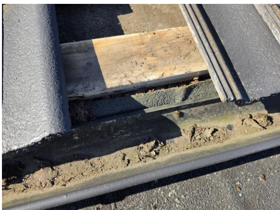
Ytpappen på garaget är uppvikta på husets underlagspapp.