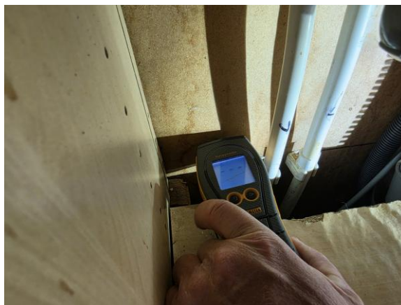
Fuktmarkeringar på baksida diskbänkskåp i kök. Vid fuktkvotsmätning noterades inga avvikelser.