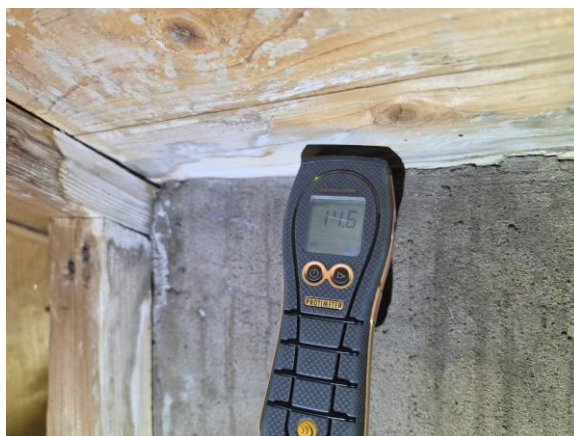
Fuktmarkeringar noterades lokalt på underlagstaket - dessa visade vid besiktningstillfället inga förhöjda fuktkvotvärden