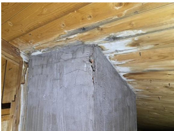
Spår av läckage runt murstocken.