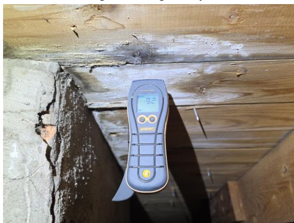
Fuktmarkeringar noterades lokalt på underlagstaket - dessa visade vid besiktningstillfället inga förhöjda fuktkvotvärden