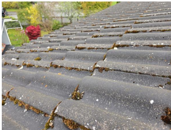
Mossa finns på takpannorna