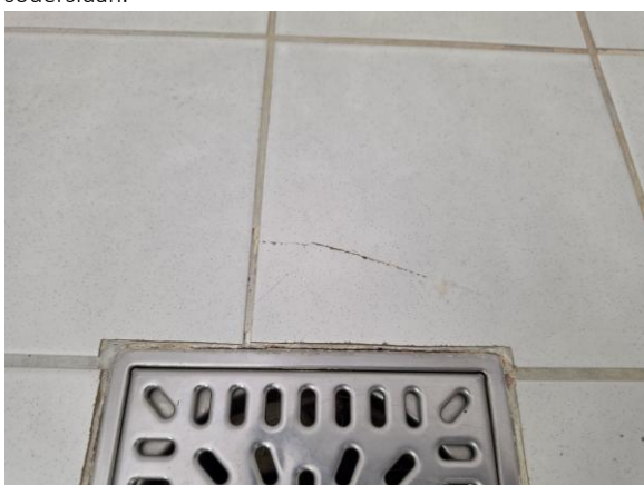
Badrummet på övre plan – Äldre våtutrymme och spricka noterades på en av klinkerplattorna.