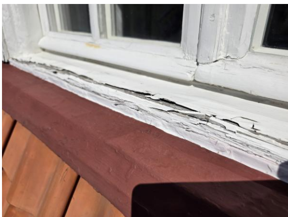
Målning/underhållsbehov förekommer på fönster på södersidan.