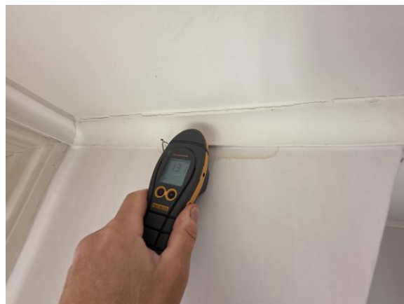
Sovrum 1 övre plan. Mindre fuktmarkering på tapet vid överkant fönster. Vid fuktindikering noterades inga avvikelser.