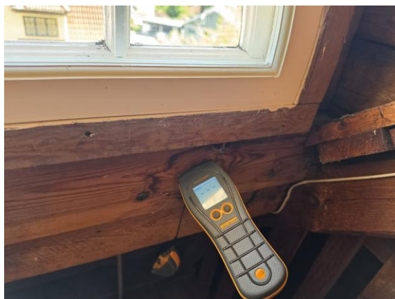
Stickprovsmässig fuktkvotsmätning utfördes i fuktfläckar i/på underlagstaket inne i vindsutrymmet utan avvikelser.