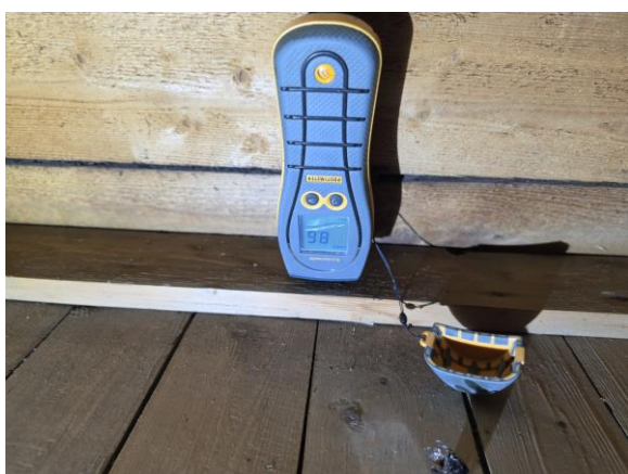
Stickprovsmässig fuktkvotsmätning utfördes i fuktfläckar i/på underlagstaket inne i vindsutrymmet utan avvikelser.