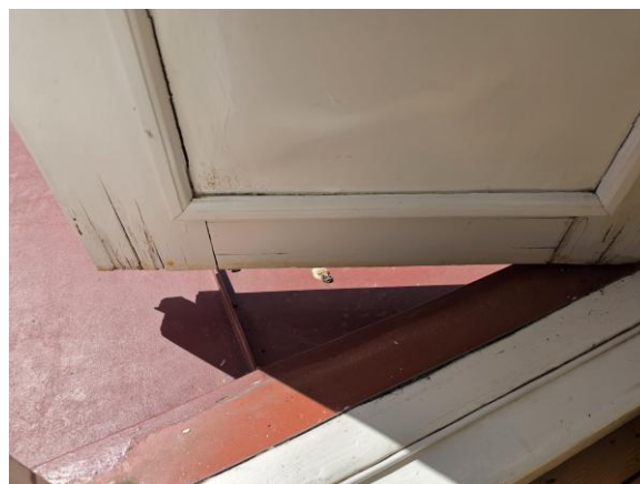
Mindre rötskada nertill på en av balkongdörrarna.