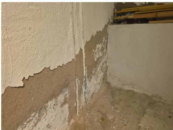
Puts o färgsläpp noterades på delar av källarväggarna.