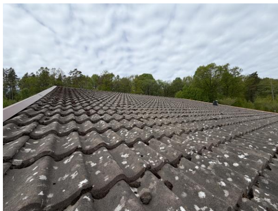
Vy från yttertak med mossa på takpannor.