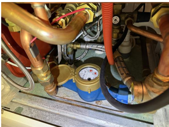
Rör genomföringar i golv avviker från dagens branschregler.