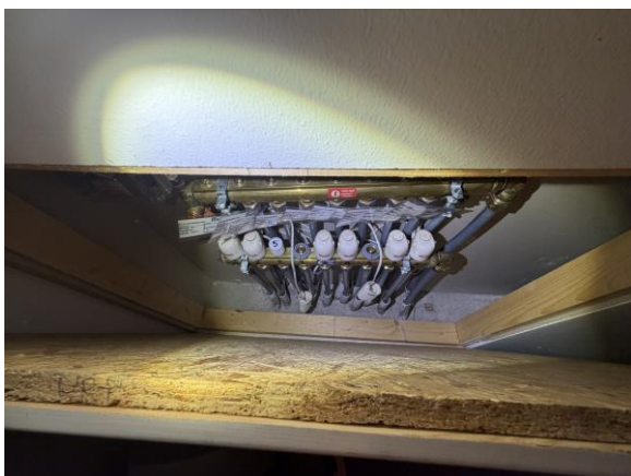
Fördelarskåp saknas till golvvärmerör.