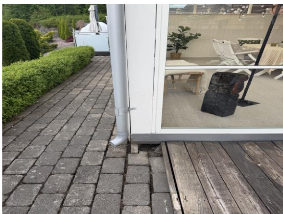
Stuprör till uterum är ej anslutet till dagvattenledning.

I denna bilaga visas ett urval av de foton som tagits vid besiktningstillfället.